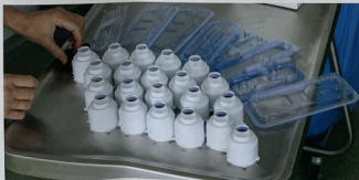
Rebecca Banens: 'Ik hoop dat anderen afval ook gaan zien als iets waardevols en dat zij er iets bruikbaar mee gaan doen.'

'De mooiste materialen zijn de ongebruikte armsteunhoezen. Die zitten standaard in een proceduuretray, maar lang niet alle oogartsen gebruiken ze. Er blijven er altijd veel over. De hoezen zijn mooi blauw en